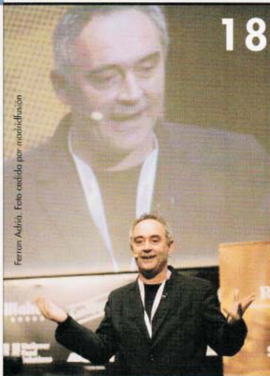
Ferran Adrià.